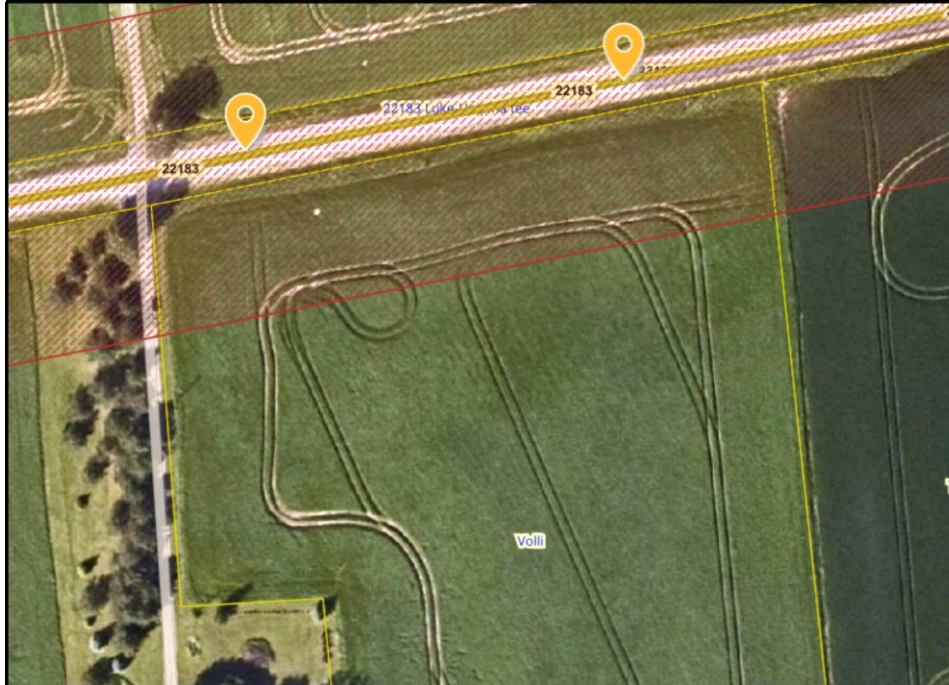
Joonis 1. Ristumiskoha asukoha vahemik tähistatud oranžide tingmärkidega